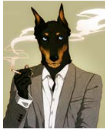
SHIN DJ, MACHINES