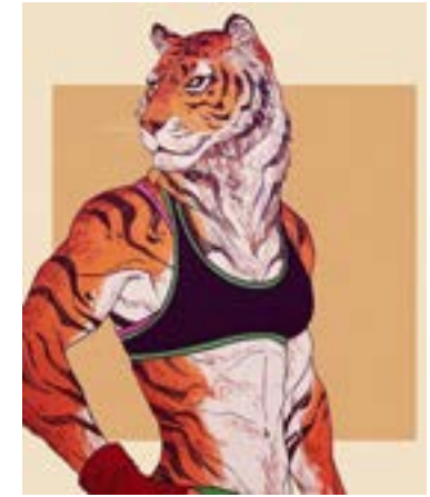
LAU HEBRARD DIFFUSION PRODUCTION